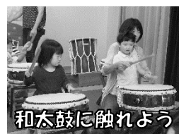
和太鼓に触れよう