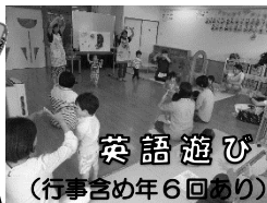
英語遊び (行事含め年6回あり)